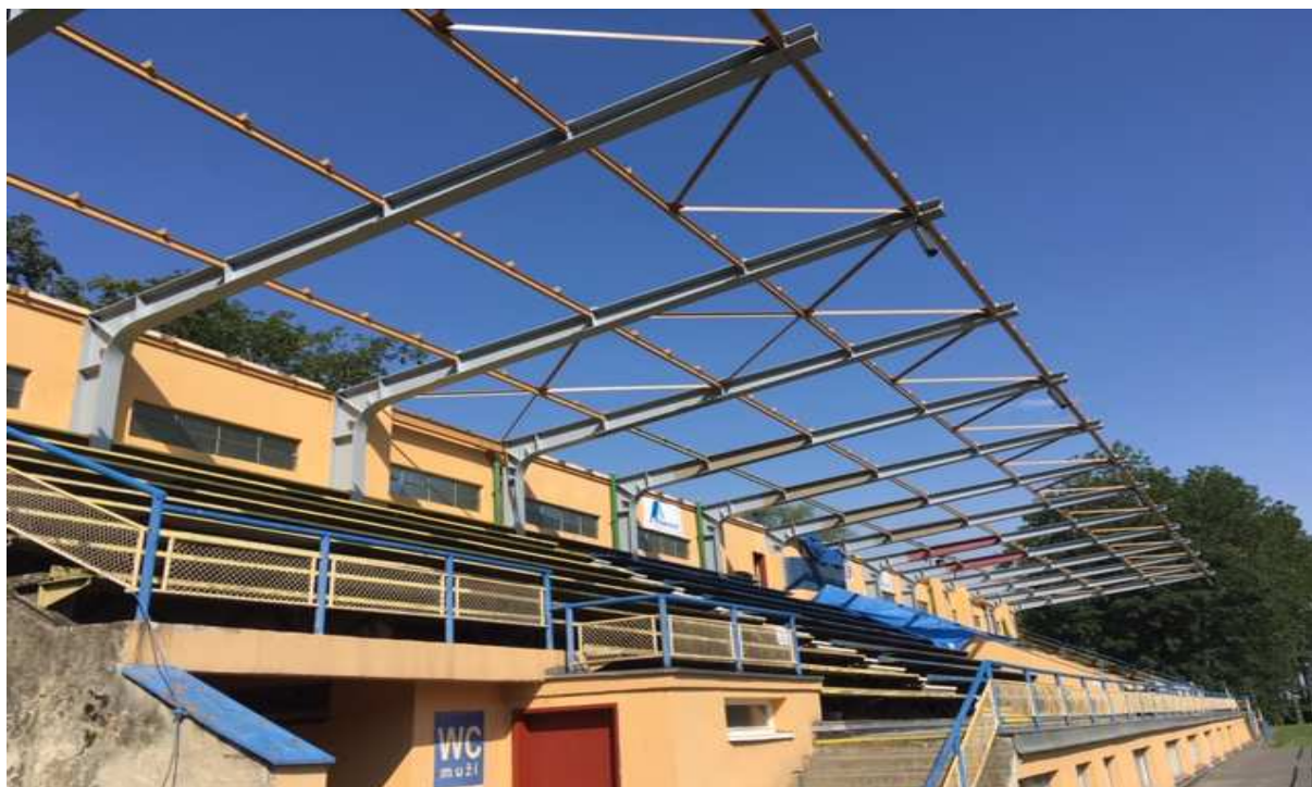
Rekonstrukce střechy Letního stadionu

Rovněž stav zázemí v tribuně již vyžaduje modernizaci. Původní rozvody elektroinstalací, vody a topení včetně odpadů v tribuně jsou ve velmi špatném stavu, poruchové a vyžadují zvýšené náklady na opravu. Stav plynové kotelny a celkových rozvodů vytápění je nutné v co nejkratší době vyřešit, zásobníky pro ohřev TUV jsou v havarijním stavu a v průběhu roku bylo řešeno několik poruch, prorezivění.