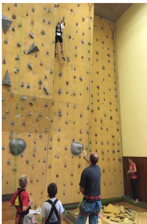
Žáci ZŠ při „výuce“ lezení na horolezecké stěně

Významnými uživateli jsou rekreační sportovci a to zejména ve sportovních odvětvích lední hokej, bruslení veřejnosti, badminton, futsal, volejbal, nohejbal, lezení na horolezecké stěně.