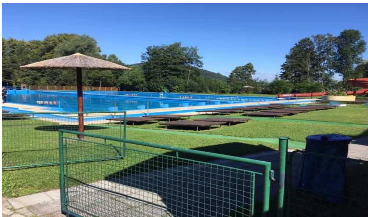
RETRO koupaliště připraveno na další sezonu