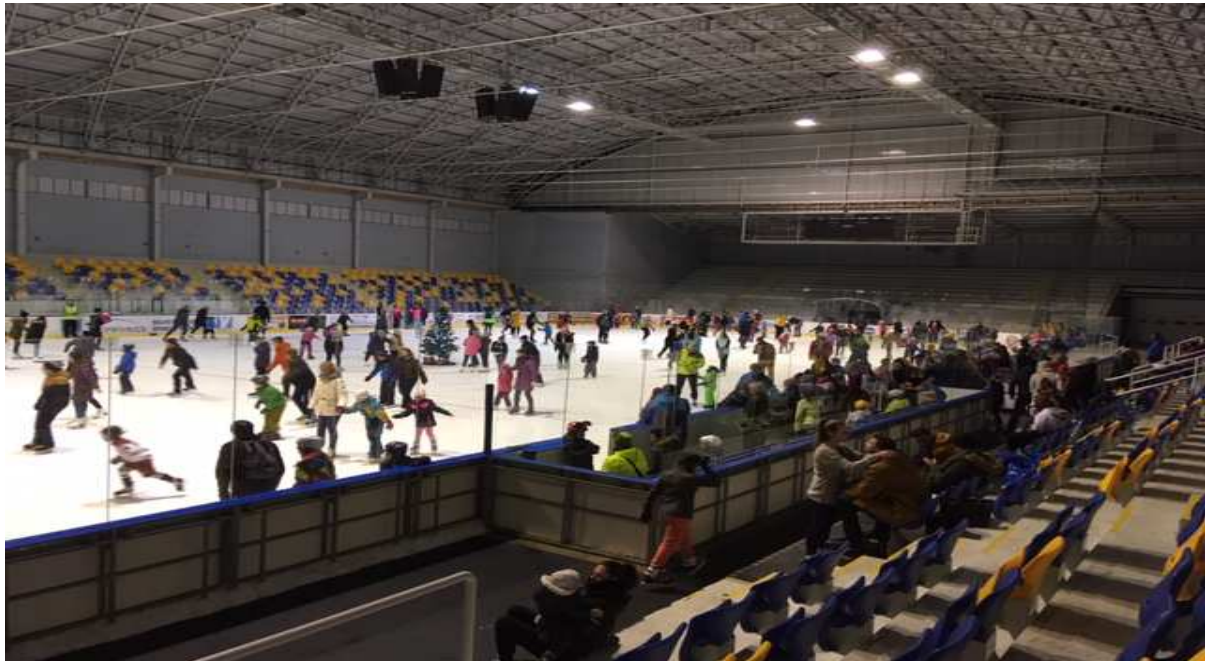
Vánoční bruslení na Zimním stadionu

Bruslení veřejnosti bylo uspořádáno 67 x a navštívilo 7 833 osob, největší návštěva 408 osob dne 28.12.2017. Bruslení pro veřejnost je organizováno pravidelně v sobotu a v neděli v pracovních dnech je ledová plocha v dopoledních hodinách k dispozici bruslařům z řad veřejnosti a školám. V dopoledních hodinách si přišlo zabruslit 908 žáků škol a 1098 osob individuálně, celkem 2006 bruslařů. Zimní stadion jako jeden z mála nabízí možnost zabruslit si i v dopoledních hodinách, jezdí zde bruslaři z okolí.